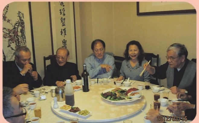
▲ 樂清同鄉聯誼會來訪會後聚餐