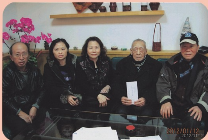
▲ 慰問新店屈尺仁愛之家鄉親