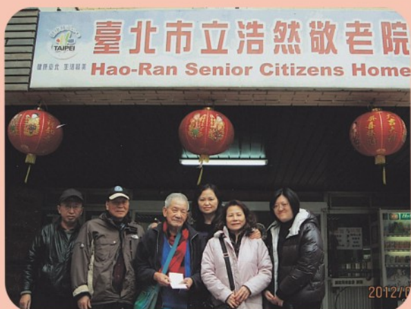
▲ 慰問浩然敬老院鄉親