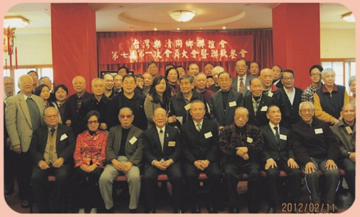
▲ 台灣樂清同鄉聯誼會春節餐會全體合影