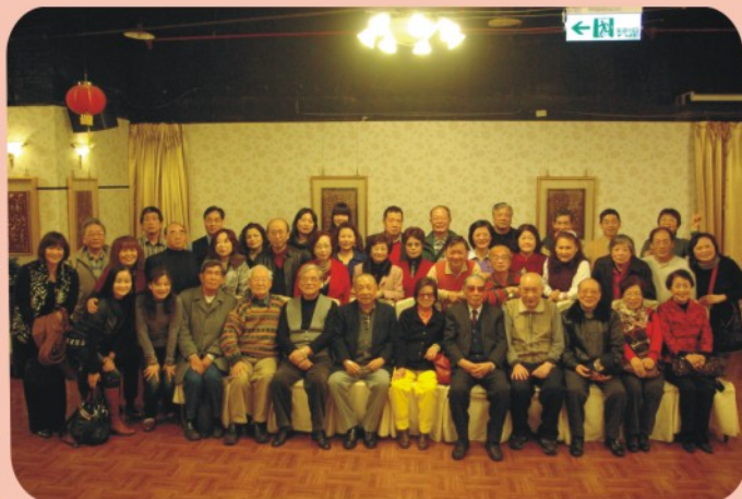
▲ 江心聯誼會會員餐會後合影留念