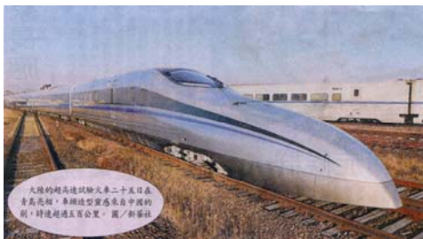
大陸的超高速試驗火車二十五日在青島亮相，車頭造型靈感來自中國的劍，時速將逾五百公里。圖／新華社

北京交通大學教授趙堅認為，法國已研發出時速五百七十四點八公里的列車，但未投入使用，大陸也不會以五百公里時速來營運。高速列車的研究方向應該在安全可靠的性能上，讓列車「開得起來，停得下來」才是正道。