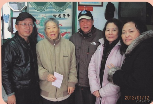
▲ 慰問基隆市仁愛之家鄉親