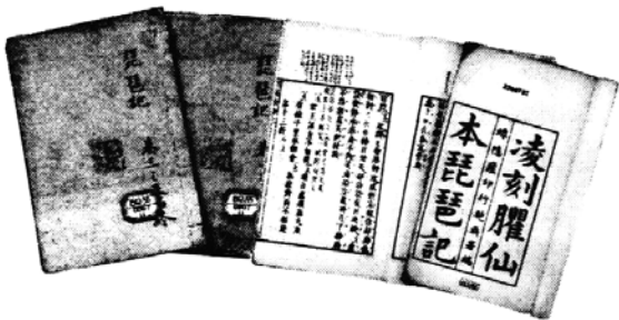
凌刻雁仙本琵琶記

(22)。他把所寫的稿本，反復吟唱，一再修改，決不苟且。《琵琶記》第一出起首云：“論傳奇，樂人易，動人難“，