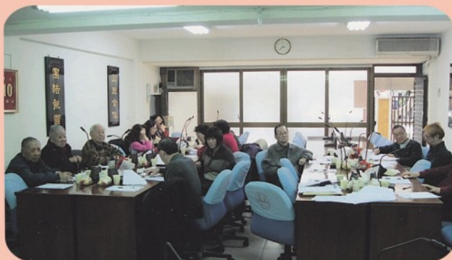
▲ 2月10日第14屆第17次理監事聯席會議開會情形