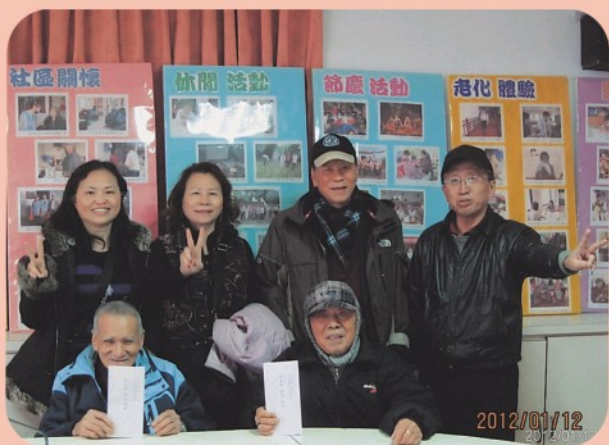
▲ 慰問萬里仁愛之家鄉親