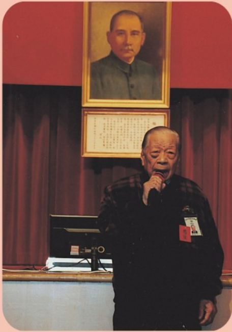
▲ 林理事長亦冲致歡迎詞