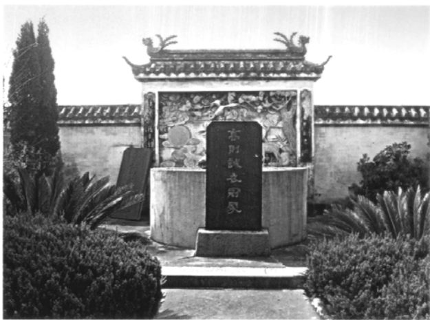
冢冠衣則高樹柏巷閣

田漢、翦伯贊、俞平伯、陸侃如、董每戡、戴不凡、王瑤、楊紹萱、李長之、尚鉞、王季思、陳多、徐朔方等近百位著名戲曲專家、學者、教授與會，盛況空前 (33) 。溫州、瑞安亦成立“高則誠研究會”，發表多篇研究文章。一九九三年十一月，瑞安市府在柏樹村建造“高則誠紀念堂”，紀念堂額匾