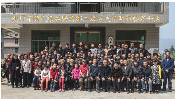
族人相迎大團圓 同祖同宗何有怨。(編按：這麼多人集在一起合照還真不多見。)