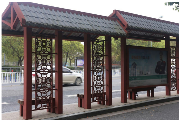
溫州市人民路公車候車亭。