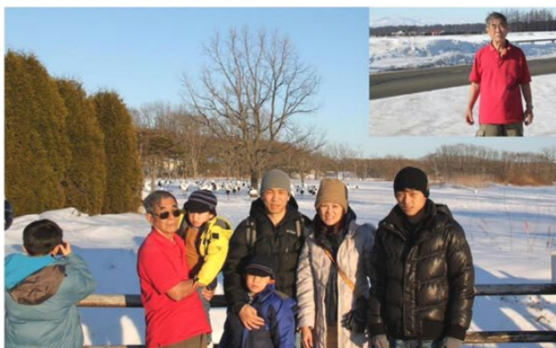
身穿短袖雪中遊，含貽弄孫樂神仙。

粗食配淡飯 座談吐塊壘 心中有故事 不忘留後人 往事再驚天 寧是夢一場 重誓願和平 老樞護團圓