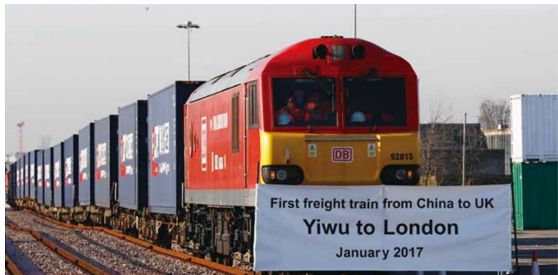
義烏倫敦第一列貨運列車 2017 年 1 月 18 日在英國倫敦舉行歡迎儀式。

北京開闢中歐貨運鐵路線，可以減少中歐貨貿的時間成本，以及不同鐵路線間轉運的費用。前述班列經由東部、中部、西部三條國際大通道直達歐洲，其中西部通道經阿拉山口出境，中部通道經二連浩特市（內蒙古自治區）出境，東部通道經滿洲里（綏芬河）出境。若從「一帶一路」的戰略視角來說，中國大陸通往歐洲的鐵道運輸建設，意味創造出新的商機。義烏倫敦線首創跨越英