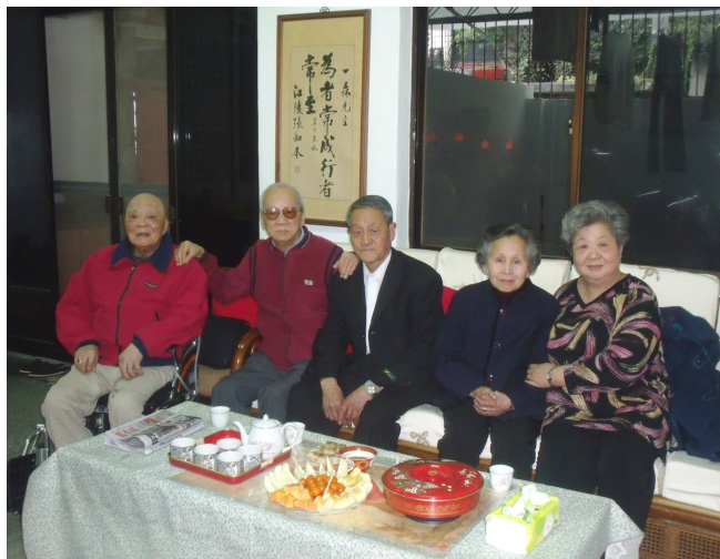
(左起二兄永興、我、小弟永虎攝於二兄家中，2013年3月永虎訪台。)

我兄離開我們已一百多天，他於民國一〇六年二月一日上午七時在睡夢中安詳辭世，距生於民國十二年八月十五日，享壽九十五歲；其時子女均隨侍在側，至誠懇切助念，祈佛接引往生極樂世界。並於民國一〇六年二月廿五日上午，假台北市第二殯儀館景仰樓，舉行佛化奠禮儀式後，隨即發引火化，安葬於台北市慈恩園。