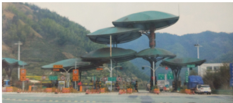
手持相機攝黃山，拍下奇景誌不忘。

僅以此文對一位八十七歲老人（不，不該稱他老人，應該稱先生，他內在外在都不像老人，而初初與他交談，對他的所言我一度以為是胡言妄語，因為太超過了，超乎我的認知超乎我的想像。）致敬。