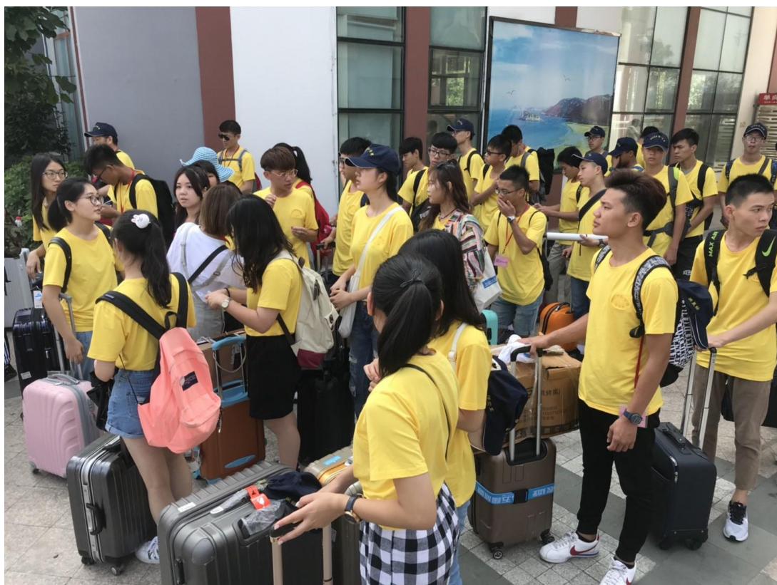
一起搭船到南麂島，又是一趟新的開始，看到平陽的小夥伴，亦是如此熱情。