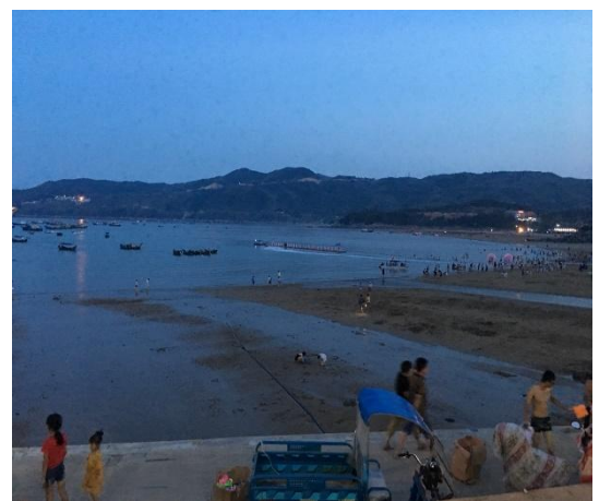
我們是 Super Idol C 位出道，之後大家一起到了魚寮的沙灘玩遊戲，讓彼此的感情更加熱絡，在那也讓我看到魚寮的觀光正在起步，是蒼南的一大商機。