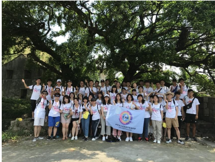
一同與蒼南的小夥伴參觀古城，陽光非常的熱情，大家也玩得非常開心。