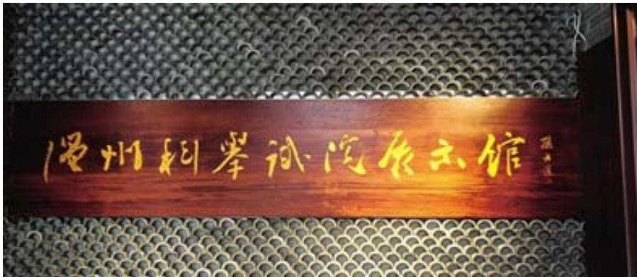
集孫詒讓字跡的館名匾

三是學風鼎盛，文武兼修。平陽歷史上除尚武外，也十分注重習文。北宋陳經邦、陳經正兩兄弟受業于程頤，創辦會文書院，授徒講課，平陽文風始盛。南宋，北方社會文化精英大批南徙平陽，促進平陽學風鼎盛，人才輩出。濃厚的文化氛圍，孕育成長了大批博文精武、智能雙全之才。平陽不少武狀元，除擁有一身好武藝外，還會寫得一手好詩文。