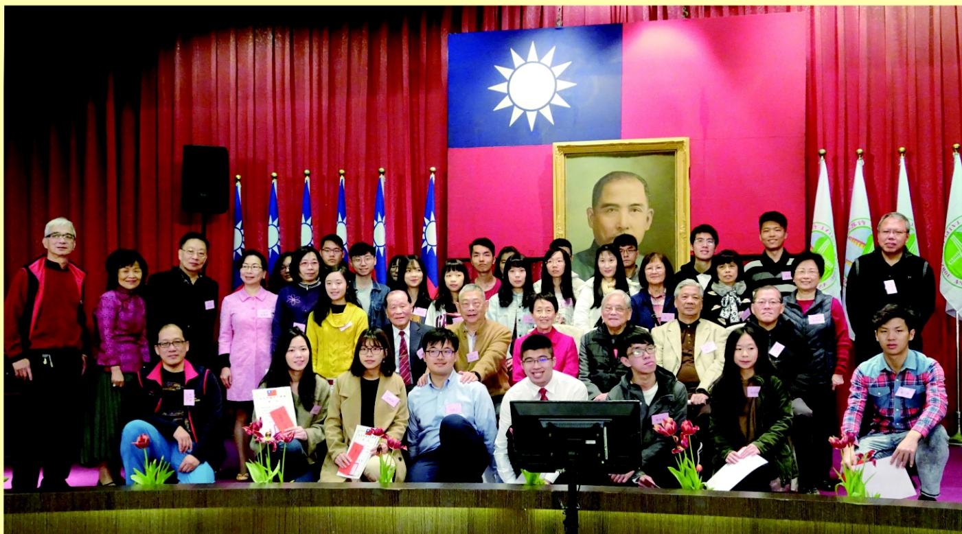
中華民國108年溫州同鄉會新春團拜 理監事們與獎助學金得獎同學合影