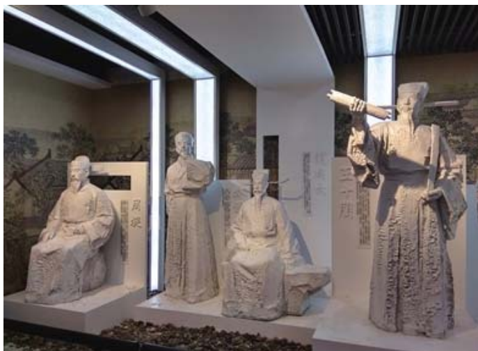
溫州科舉試院展示館裏的狀元塑像（局部）

禪街溫州八中門口新辟有溫州科舉試院展示館，參觀者絡繹不絕。進館處大書「溫多士為東南最」，向觀眾揭示展館的主題。展版重點突出了宋代溫州科舉興盛的特徵（進士登科多，高科進士多，官居高處多，家族登科多）與原因（科舉制度的改革，政治經濟地位變化，永嘉學派形成與傳播，權勢人物的支持，地方辦學的興盛），整體上有聲有色，立體地展示了古代溫州科舉文化的概貌。